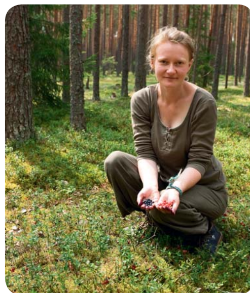
Peotäis pohli ja teine mustikaid

ääres maitsta vitamiinirohkuse tõttu põhjala sidruniks peetavaid punaseid jõhvikaid . Sooservas aga ootavad mekkimist sinikad, pohlad ning mustikad . Janu võib kustutada peoga kirbe maitsega laukavett ammutades, sest sellest puhumat jooki ei leia mitte kuskilt.