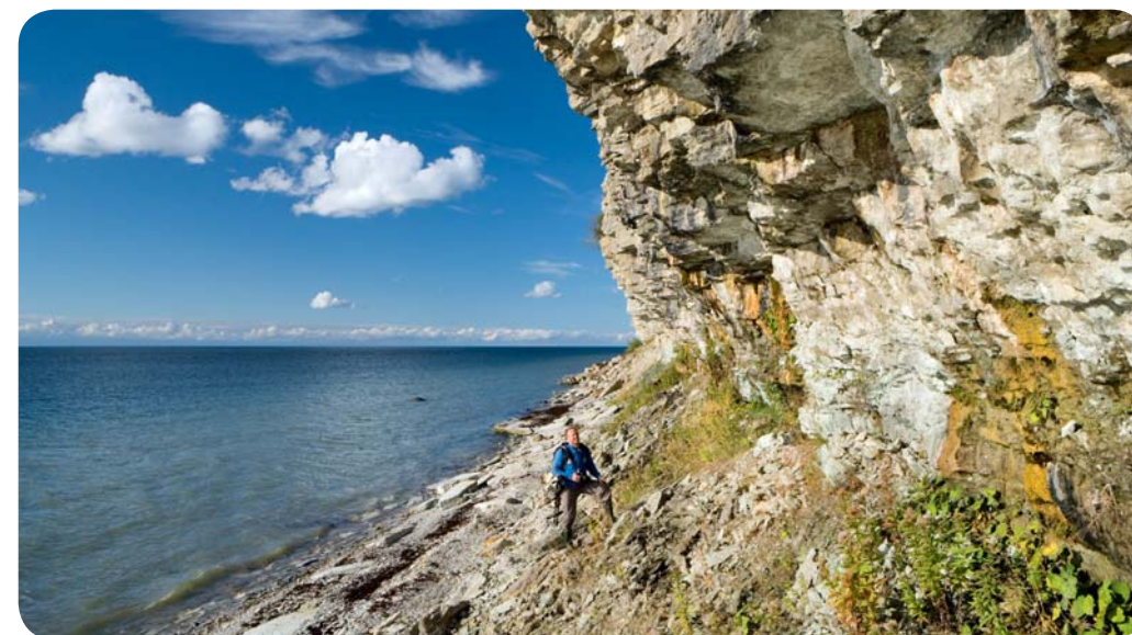
Tükike Põhja-Eesti pankrannikut

Eriti just kevadise ja sügise suure ajal, aga ka muudel aastaegadel pakub uhket vaatepilti Eesti võimsaim, kaheksa meetri kõrgune Jägala juga.