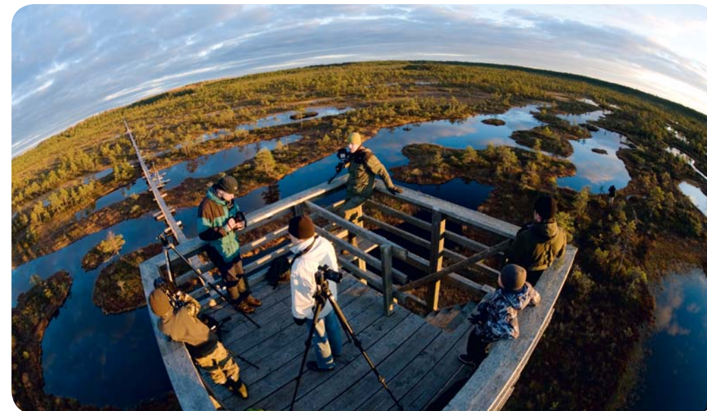
Linnuvaatlustorn Endla looduskaitsealal

linde. Tegu on tähtsaima maamärgiga nii veekui ka röövlindudele, aga ka miljonitele värvuliste . Aegade jooksul on selles piirkonnas nähtud üle 270 linnuliigi, parematel rändepäevadel võib neist vabalt pooled ära näha. Just selline rändeelamus meelitabki igal sügisel magnetina Sõrve kokku linnusõpru üle kogu maailma.