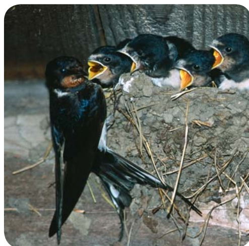
Eesti rahvuslind – suitsupääsuke

Lindude vaatlemise teevad mugavaks ennekõike kaitsealadele, aga ka mujale rajatud arvukad linnuvaatlustornid , kust on võimalik heita pilk ka paikadele, mis on muidu ligipääsmatud.