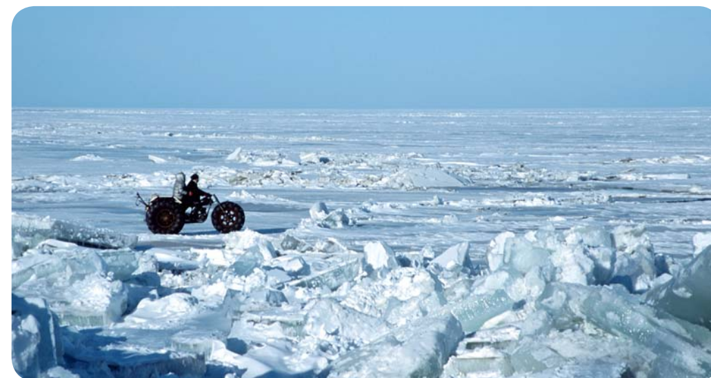
Kalamehed Peipsi järvel

Suvel meelitavad sooja veega järved ligi hulgalt suplejaid. Omakorda talviti tõmbavad jääga kaanetatud järved magnetina uisutajaid. Näiteks Peipsi järvel on traditsiooniks saanud igatalvised uisumaratonid. Tasase vooluga jõed on populaarsed kanuusoitjate seas. Parimaks kanuutamisjõeks peetakse Lõuna-Eestis voolavat Võhandu jõge, mis on ühtlasi oma 162 kilomeetriga Eesti pikim.