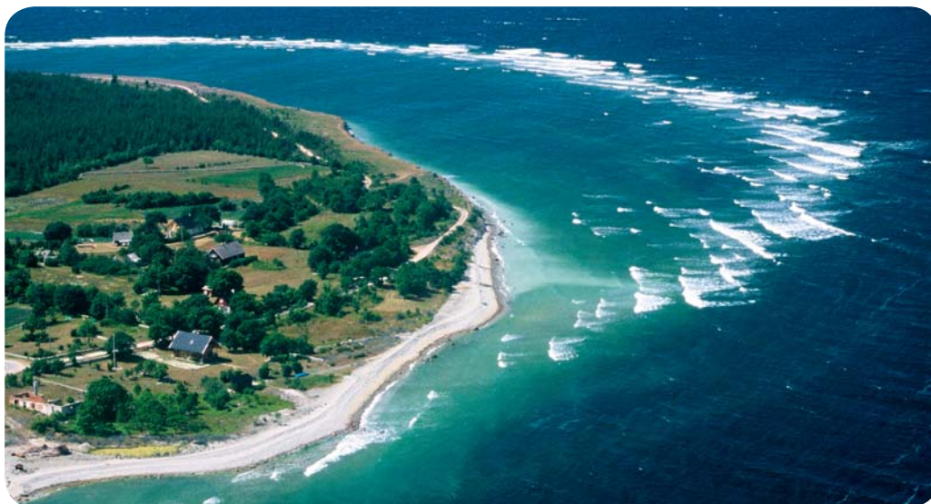
Lained lihvimas Saaremaa randa