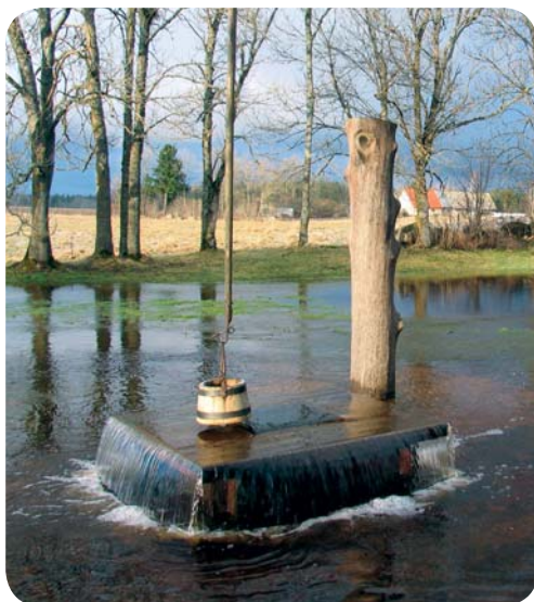
Tuhala nõiakaev on keema läinud

Põhja-Eesti paese aluspinna on vesi mõnes kohas justkui augulist juustu meenutavaks karstiks kulutanud. Näiteks Tuhala maastikukaitsealale jääb Eesti suurim karstiala, mis on kogu maailmas tuntust kogunud endale kivimitesse süngid