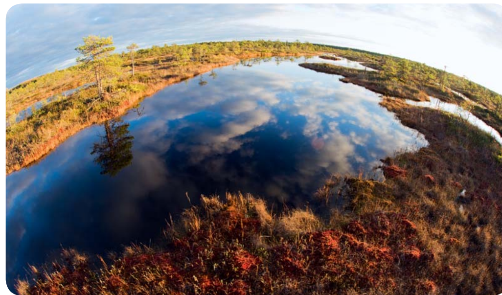
Õhtune vaade rabale