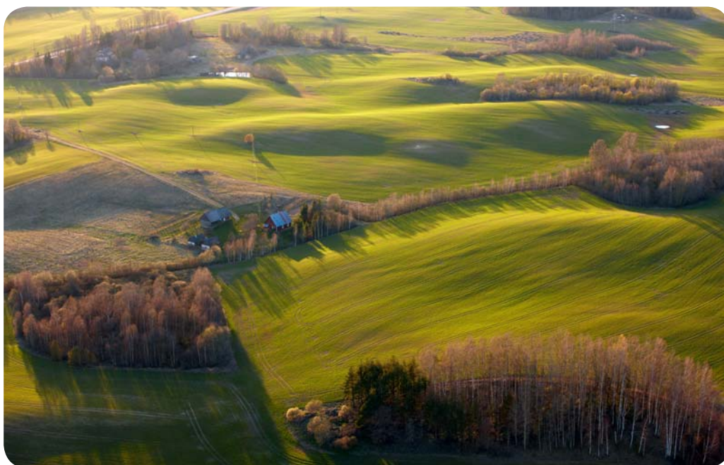
Vaade Lõuna-Eesti kuppelmaastikule

Eesti ja ka kogu Põhja-Euroopa jäätumisala suurimat rändrahnu, Ehalkivi näeb Kunda linna lähedal Letipea neemel. Otsapidi madalas merevees asuva kivimüraka ümbermõõt küünib 50 meetrini ehk selle suudaks enda embusse haarata ligi neljakümnepealine seltskond käsi ühendades. Kaalub see aegade jooksul ümaraks kulunud kaljukamakas aga üle 2400 tonni.