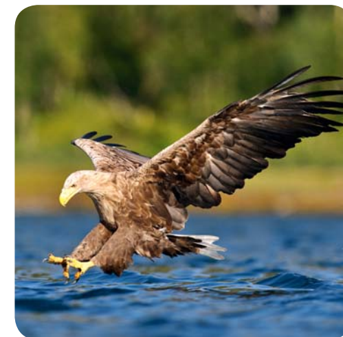
Merikotkas jahti pidamas

Kui Ölandil on paekivist klindi kõrgus vaid 10 meetrit, siis Eesti põhjarannikul Ontikal saavutab pank oma maksimaalse kõrguse – 56 meetrit.