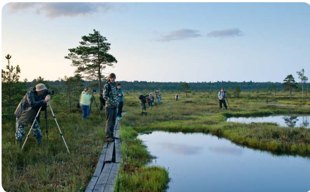
Loodushuvilised Nigula rabas

Eesti ürgsete metsade sümbollinnud on aga metsised ja kotkad: kaljukotkad, kalakotkad, konnakotkad.