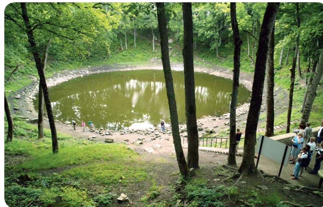
Kaali meteoriidikraater Saaremaal

Peale selle, et mandrijää Eestisse rändrahnud tõi, kujundas see oma meele järele korralikult ka maastikku üldse. Just mandrijää kätetöö on kogu Baltikumi kõrgeim ja üks kaunimaid kante – Lõuna-Eesti kuppelmaastik . Üks ümaraks lihvitud metsane või siis põldude või niitudega küngas ajab teist taga, sekka sinavaid järvesilmasid ja imeilusaid orgusid. Selle ümarate vormidega ideaalmaastiku kehastuseks on Karula rahvuspark.